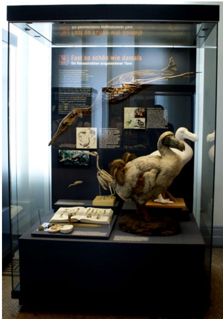
Eine Dronte wie lebendig im Museum für Naturkunde, Berlin