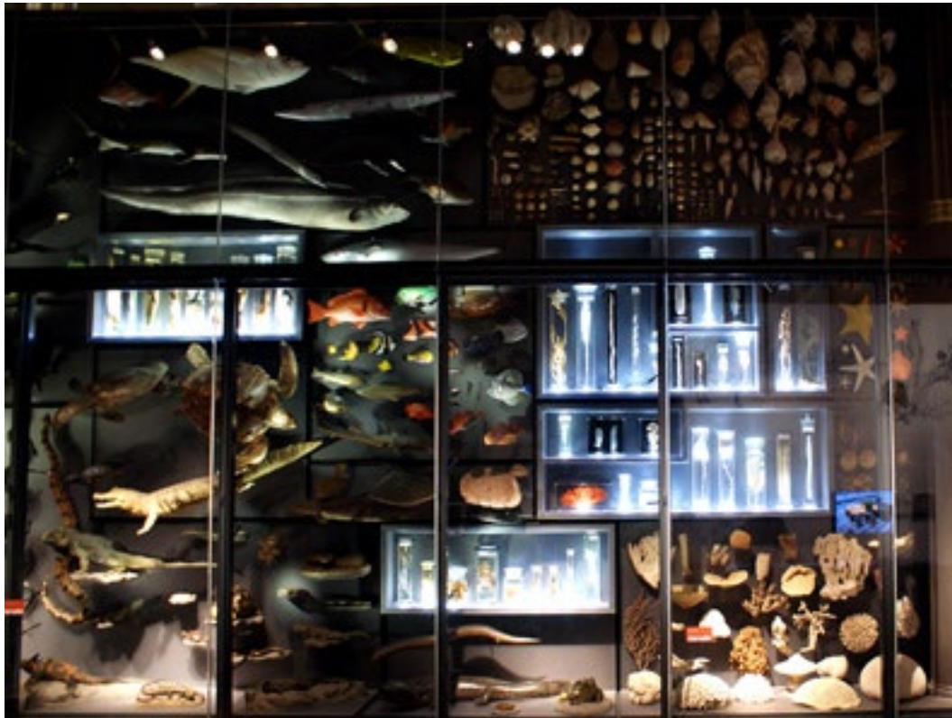
Systematischer Schaukasten mit Meerestieren im Museum für Naturkunde, Berlin

"Das Abenteuerliche Herz" ist nicht irgendein Text von Jünger. Vielmehr kann er als ein zentraler für sein Werk genommen werden. Einschätzungen, dass "Das Abenteuerliche Herz" zu Jüngers schwächeren und weniger bedeutenden Texten gehöre, können nur als völlig verfehlt eingestuft werden.