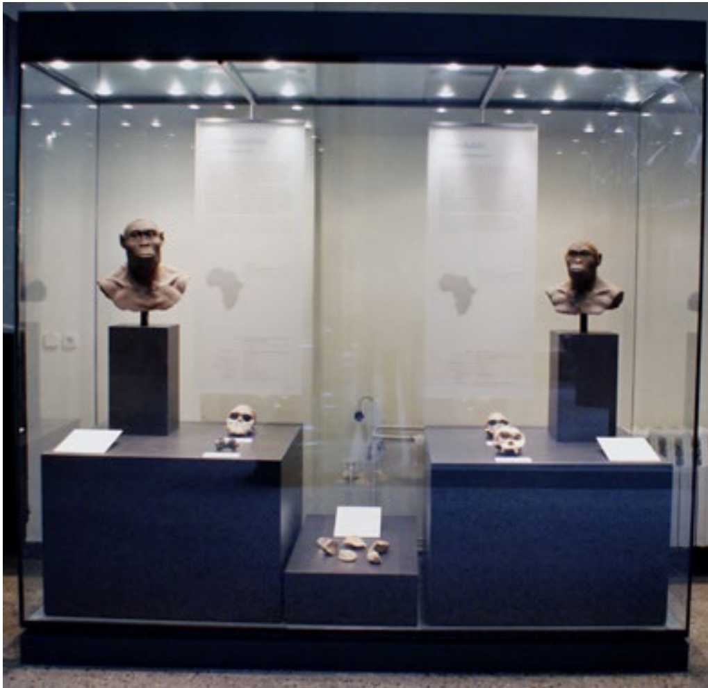
Zoologische Vorfahren des Menschen im Museum für Naturkunde, Berlin

Martin Wuttke knüpft mit seiner Textfassung, Inszenierung und Darstellung der Figur des Dr. Fancy haargenau an das Interview an. Wenn die sieben Herren des Stückes schwül und weiblich in seidenen Morgenmänteln, kurzen Unterhosen und mit wahllos verrutschenden Haarteilen durch das bestuhlte Foyer schreiten und sich in die Vitrine begeben, schimmert André Müllers Feststellung durch, dass Jugendfotos von Ernst Jünger einen „zarten, fast femininen Jüngling zeigen“. Jüngers männliches Pathos wird durch die Inszenierung damit von Anfang an brüchig.