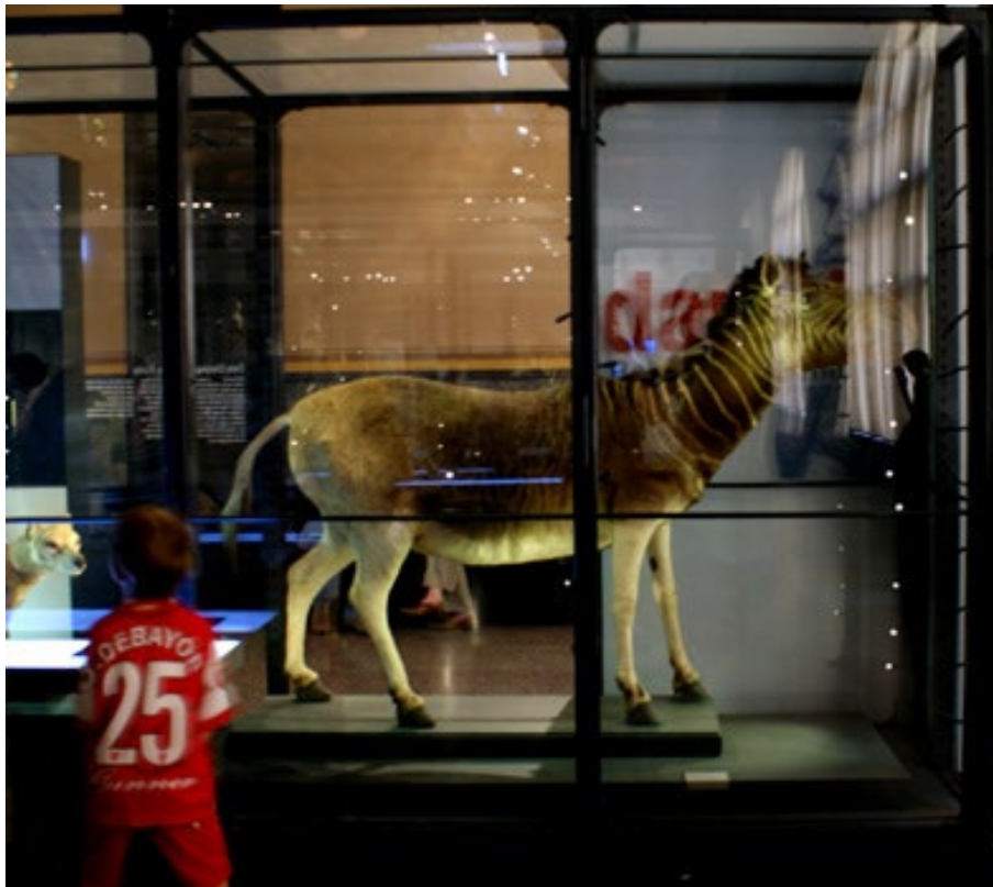
Quagga im Museum für Naturkunde, Berlin

Im Museum für Naturkunde in der Invalidenstraße unweit des Berliner Ensembles, nur einmal um die Ecke von Bertolt Brechts letzter Berliner Wohnung in der Chausseestraße sind in mannshohen Glasvitrinen ausgestorbene Quaggas, Gürteltiere und Nasenbären zu betrachten. In der Spätvorstellung des Berliner Ensembles um 22:30 Uhr im üppig dekorierten Foyer aus der vorletzten Jahrhundertwende steht eine vergleichbare Vitrine im Scheinwerferlicht. Neobarocke Einrichtungsgegenstände, üppige Federkissen und ein Toaster bereiten das Biotop für das Tier Mensch.