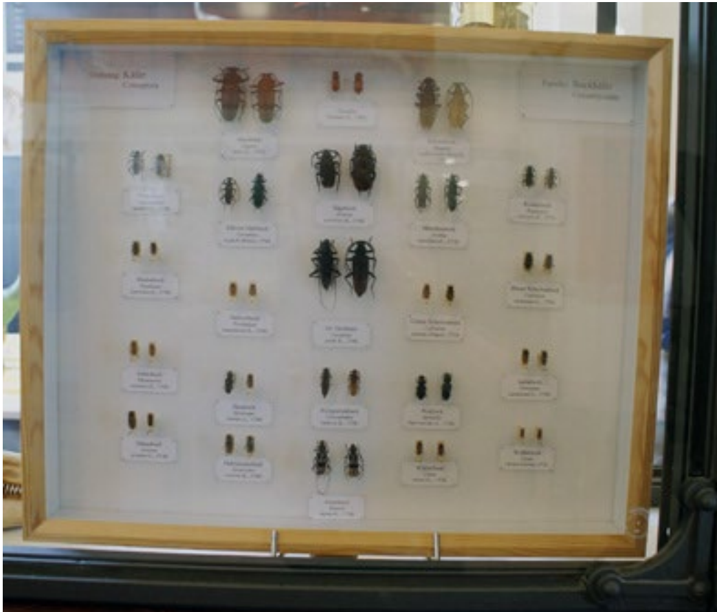
Schaukasten mit der Systematik einer Käfergattung im Museum für Naturkunde, Berlin

Das Tier Mensch in einer reaktionären Aufspaltung von Gut und Böse gehört in den Schaukasten. Das macht Wuttke klar. Ob es die pantomimische Erinnerung an Gustav Gründgens' Mephisto ist, das Ekstatische der Sacre du Printemps oder das Bombastische der Bohemian Rhapsody von Freddy Mercurys Queen, Räusche dienen nicht mehr der Erfahrung oder gar Erkundung des Bösen. Räusche sind zutiefst historisch. Das Koma durch Saufen verspricht eben nicht mehr den Moment der Erweiterung, sondern hält nur noch Auslöschung und Leere bereit.