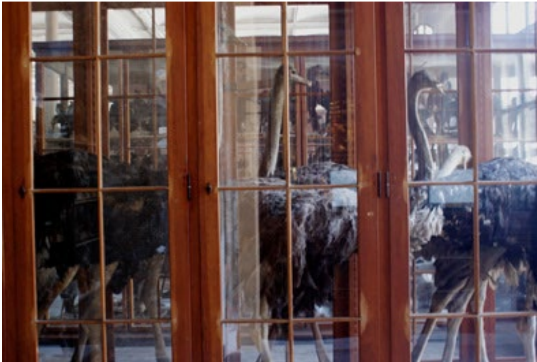
Straußenvögel in einem Schauschrank im Museum für Naturkunde, Berlin