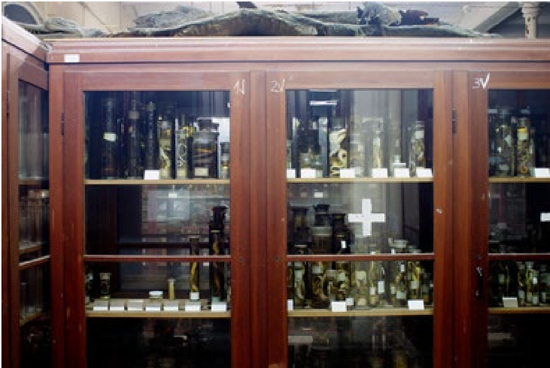
Reptilien in und auf einer Vitrine im Museum für Naturkunde, Berlin

Martin Wuttke hat in seiner Inszenierung über der Vitrine Filmeinspielung aus den zwanziger und dreißiger Jahren projizieren lassen. Ausschnitte aus dem Golem-Film von Paul Wegener von 1926 oder aus dem Faust-Film von Friedrich Wilhelm Murnau, ebenfalls 1926, und anderem mehr. Dadurch werden Zeitbezüge zu den Texten Jüngers hergestellt. Er war eben kein überzeitlicher Schriftsteller. Vielmehr war er zutiefst in die Bilder- und Diskurswelten seiner Zeit verwoben.